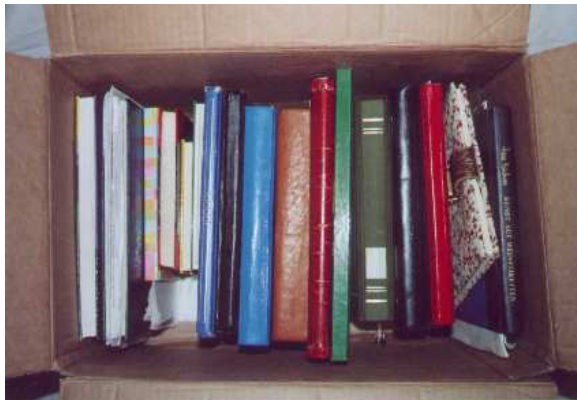
Ein Karton voller Lebensspuren (Nr. 1293)

Der Autor (geb. 1931) erlebte 1944 bis 1947 als Jugendlicher von 13 bis 16 Jahren Krieg, Flucht und Nachkriegszeit hautnah. Da er sah, dass seine Mutter und viele andere Frauen in dieser schweren Zeit Überleben und Zusammenhalt der Familie erkämpften, nannte er seine Erinnerungen „Die Frau“.