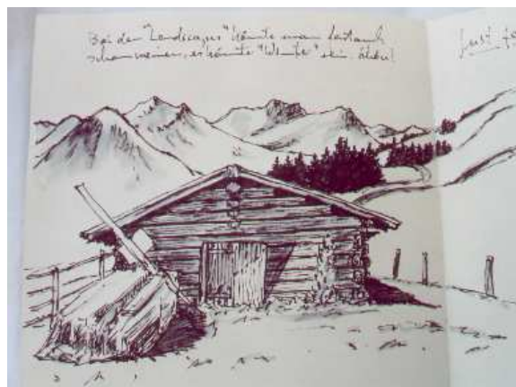
Tagebuch eines Künstlers (Nr. 1248)

Der Autor, wahrscheinlich ein Künstler, der sein Geld mit Nachtwachen verdient, berichtet 1983 bis 1989 seinen Freunden in 86 Briefen von seinen Tätigkeiten, seinen Gewohnheiten und seinen Reisen, meist nach Kreta. Sein Stil ist amüsan, er ist gebildet und vielseitig interessiert.