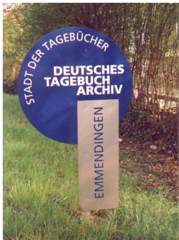
Beschilderung an den Ortseingängen der Stadt

aber doch durch „die Hölle“. In den Briefen werden der harte Existenzkampf im Berlin der Nachkriegsjahre, die Benachteiligung gegenüber ehemaligen Nazis und die seelischen Belastungen aus der Zeit der Bedrohung deutlich. 1955 hat sie ihrem Leben ein Ende gesetzt