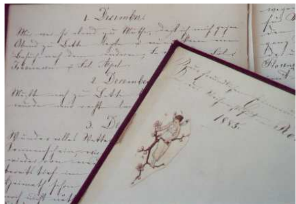
Italien-Tagebuch von 1886 (Nr. 1202)

eine junge Frau richten, die er manchmal „mein süßes Mädels“ nennt. Diese schreibt seiner Mutter aus Berlin 1918 einen traurigen Brief zu seinem Tod und schickt ihr die Leichenrede des Militärpfarrers.