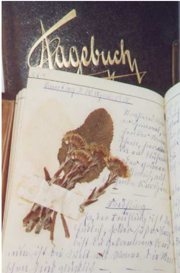
Trockenblumen als Tagebuch-Schmuck (Nr. 1256)

2: Nach dem Krieg darf ihr Mann, der bei den Nazis Berufsverbot hatte, wieder malen. Ihr Tagebuch von 1947/48 handelt vor allem von ihrer Besorgnis um ihn, von seiner Krankheit und seinem Tod.