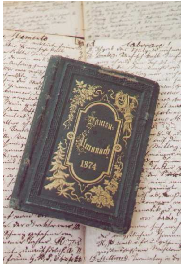
Damen-Almanach (Sig.-Nr. 1166 / II)

Feldpost-Briefwechsel eines Ehepaares von 1941-43. Die Ehefrau (geb. 1916) schreibt aus Freiburg und Konstanz – der Ehemann aus Füssen und Polen. Der Mann ist in Russland gefallen.