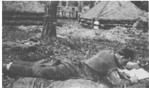
Tagebuch schreibender Soldat im 2. Weltkrieg

Der Autor (1923-43) meldet sich mit 17 Jahren als Freiwilliger zur Panzertruppe. Er schreibt seinen Eltern 232 Briefe: 1941 vom „Reichsarbeitsdienst“ in Leck und seiner Rekrutenzeit in Weimar; 1942/43 von seinem ersten Einsatz in Russland, seiner Ausbildung zum Reserve-Offizier und seinem zweiten Einsatz in Russland als Leutnant und Kompanieführer bis zu seinem Tod nach schwerer Verwundung. (Anlage: Kondolenzbriefe an die Eltern).