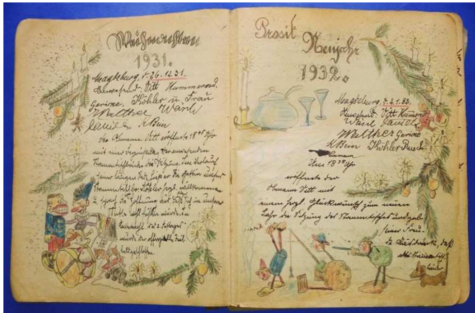
Aus dem Tagebuch des 20-jährigen Emil Sch. (DTA-Signatur 1754 / I, 2)

Die vier Kleider, zwei Schürzen, rosa Tuch, Blumenkranz, vier Paar Handschuhe, drei Paar Schuhe, Briefftasche, Tasche, Bilder, Gürtelschnalle, Kopfbänder, zwei Scheren, Mütze, Band etc. machten mich durchaus glücklich und befriedigten mich ganz und gar.